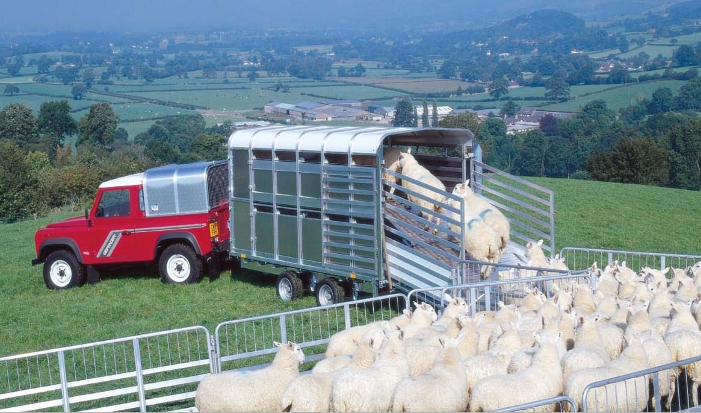
Remolques ganaderos Ifor Williams