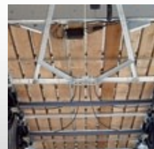
Chasis y suelo