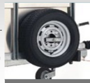
Rueda de repuesto