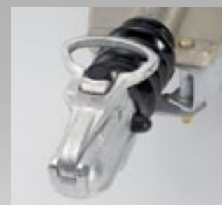
Cabezal de enganche