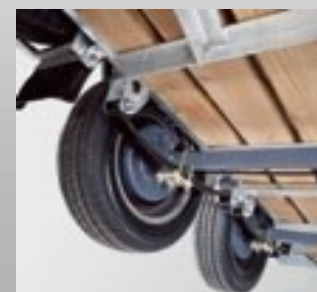
Ejes y suspensión