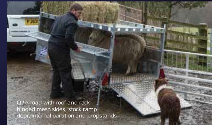
Q7e road with roof and rack, hinged mesh sides, stock ramp door, internal partition and propstands

* El techo y la baca tienen un peso máximo recomendado de 50 kg y utiliza dos cierres que se quitan fácilmente.