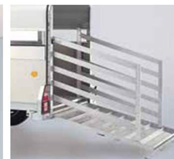
Opcional portillas disponible Q6, Q7 y Q8