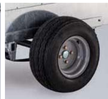
Q5/6/7e off-road ruedas flotación (20.5 x 8-10)