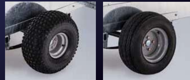
Q5 Q5e off-road and carretera con división interior, laterales ciegos y abatibles.