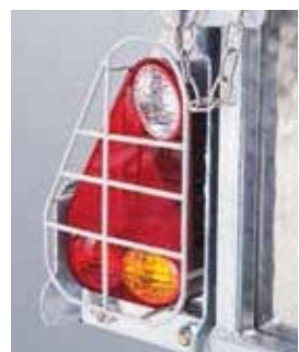
Opcional protector pilotos