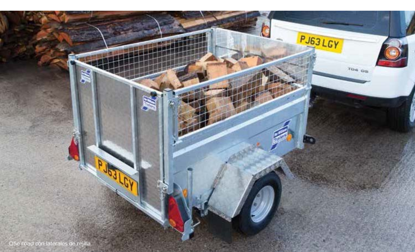
Q5e road con laterales de rejilla.