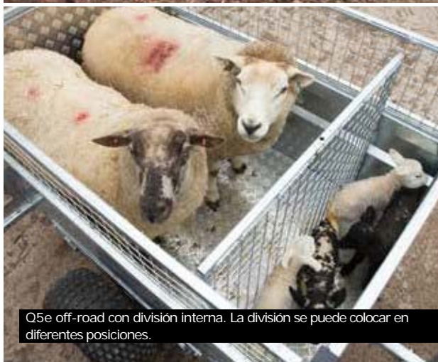
Q5e off-road con división interna. La división se puede colocar en diferentes posiciones.