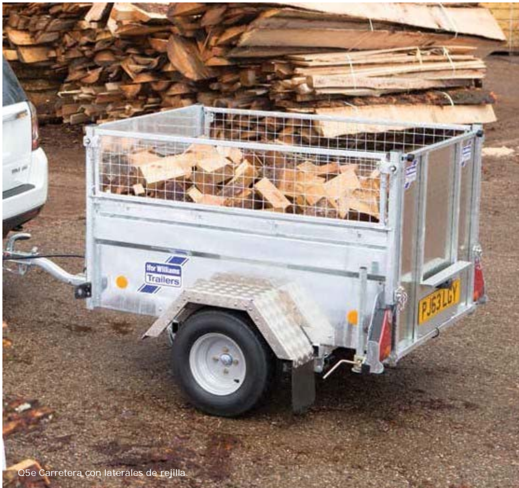
Q5e Carretera con laterales de rejilla.

*Por favor, consulte el manual del fabricante del vehículo de remolque para conocer el límite máximo de remolque sin frenos.