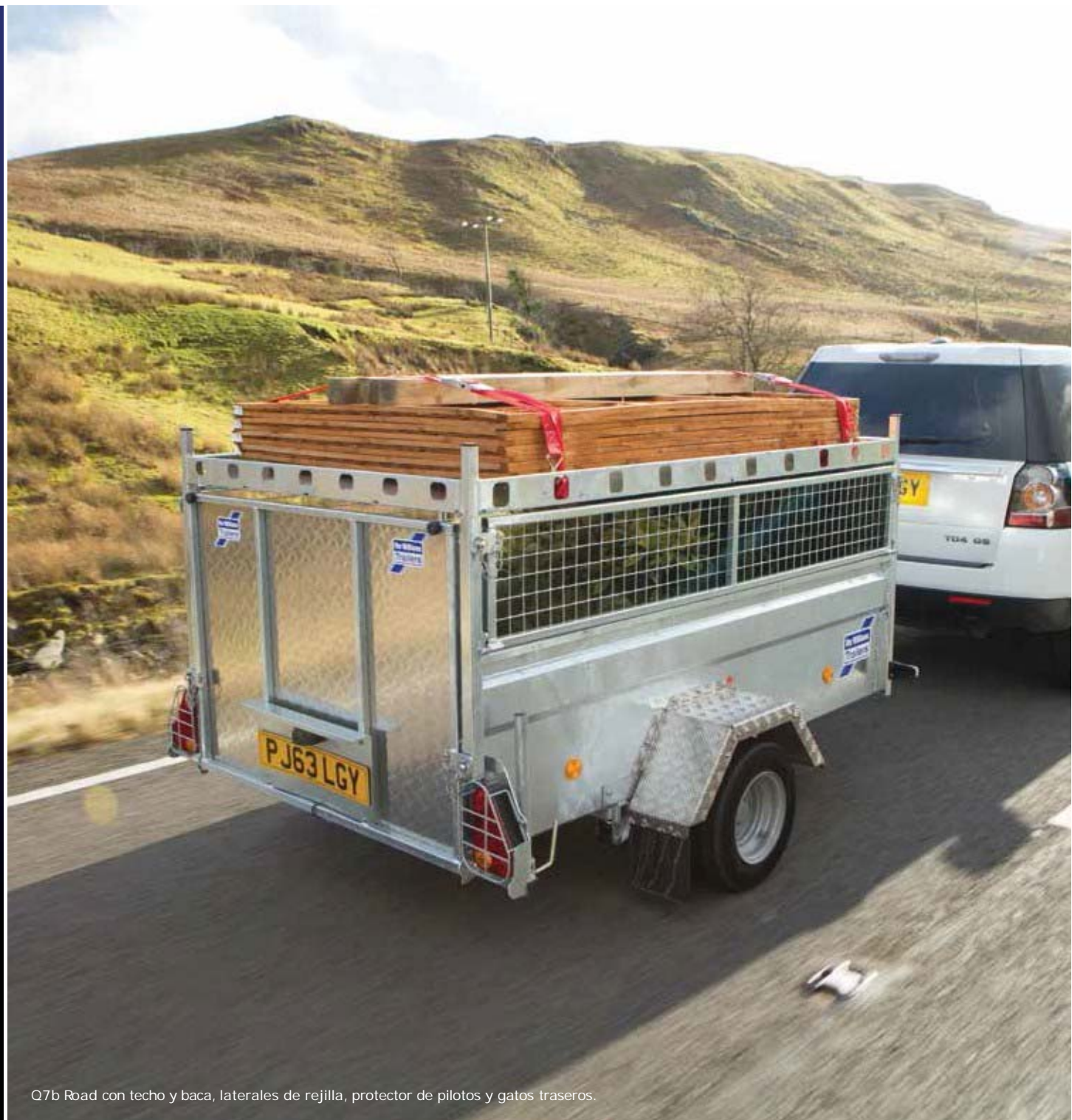
Q7b Road con techo y baca, laterales de rejilla, protector de pilotos y gatos traseros.

Somos una compañía independiente con un enfoque: construir los mejores productos del mercado. Más de 30.000 personas eligen nuestros remolques cada año, pero no nos quedamos quietos. Nuestra dedicada inversión en nuevas tecnologías y materiales asegura que nuestros productos continúen superando las expectativas de nuestros clientes. Sabemos que la calidad, la resistencia, el valor y la facilidad de mantenimiento son de vital importancia para usted. Por eso los hemos convertido en la fuerza motriz de todo lo que hacemos.