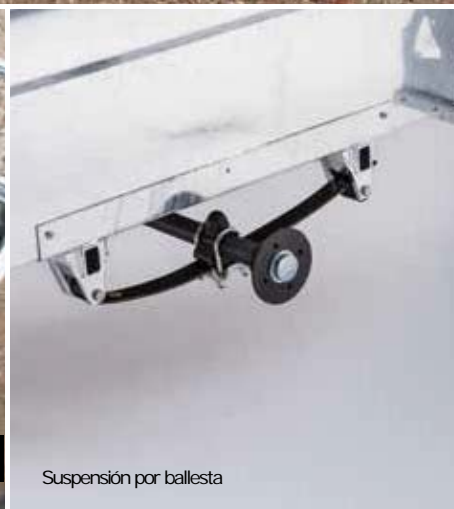
Suspensión por ballesta