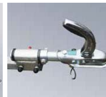
Opción de enganche giratorio disponible sólo para uso fuera de carretera (No aprobado para uso en carretera*)