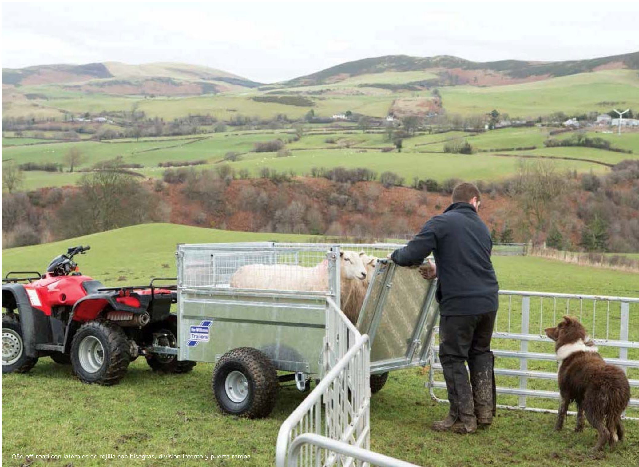
Q5e off-road con laterales de rejilla con bisagras, división interna y puerta rampa.