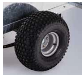
Q5e off-road neumáticos de tacos (22 x 11-8)