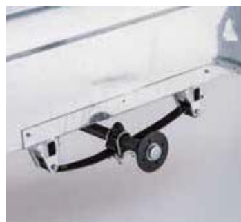
Suspensión por ballesta de serie